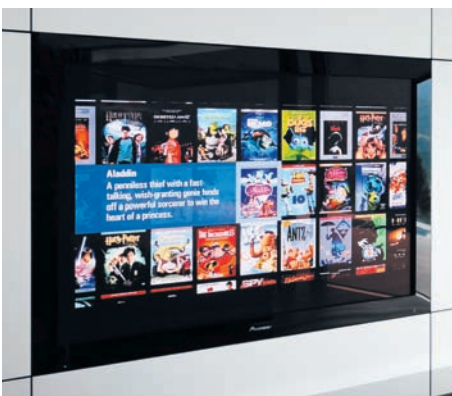
Musik und Heimkino mit Kaleidescape. Archivierung und Suche nach Titeln, Genre, Darstellern, Erscheinungsdatum etc. – einfach und bequem.